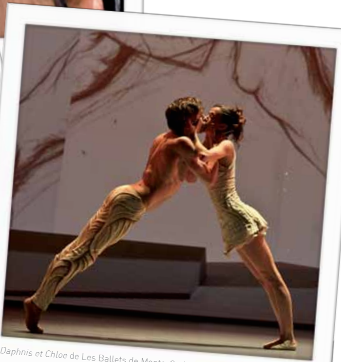
Daphnis et Chloe de Les Ballets de Monte-Carlo