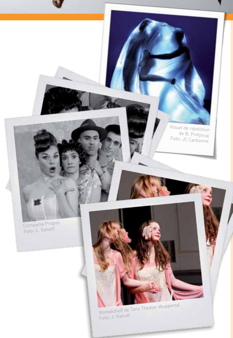
Visuel de répétition de B. Preljocaj