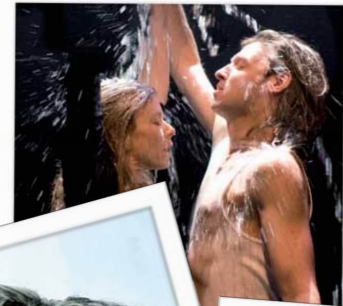
Children de Louise Lecavalier