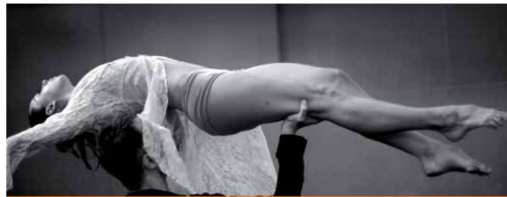
▼ Sangrepura de Ramón Oller.