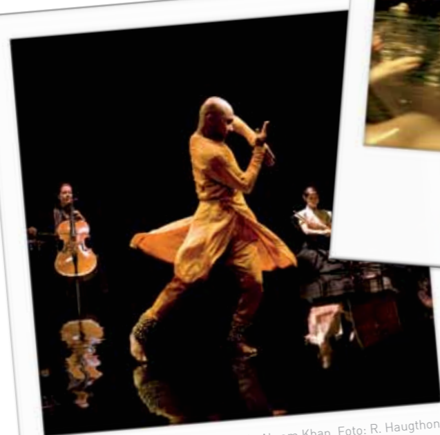
Gnosis de Akram Khan.